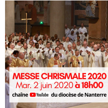
MESSE CHRISMALE 2020 Mar. 2 juin 2020 à 18h00 chaîne YouTube du diocèse de Nanterre

Messe présidée par Mgr Matthieu Rougé, Evêque de Nanterre pour les Hauts-de-Seine.