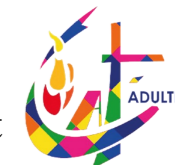
Table Ouverte Paroissiale d'avril !

Mercredi 03 avril de 20h30 à 22h30 à Notre-Dame : temps d'enseignement et de partage. Dates suivantes : 8/5 et 5/6 ; Renseignements : Agnès Rafalowicz (06 99 50 62 80)