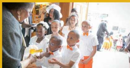
Table Ouverte Paroissial

TOP, groupe de paroissiens en partenariat avec le Secours Catholique qui invite pour un repas partagé un samedi à midi par mois des personnes seules, isolées et/ou en situation de précarité.